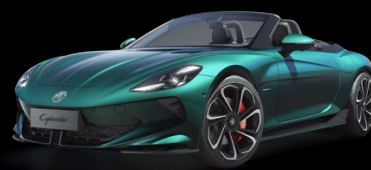
Zelená Mystic Metalický lak 25 000 Kč