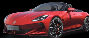
Červená Diamond Metalický lak 25 000 Kč