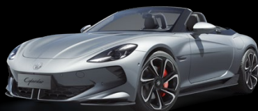
Stříbrná Medal Metalický lak 25 000 Kč