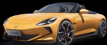
Žlutá Inca Metalický lak 25 000 Kč