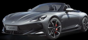
Šedá Andes Metalický lak 25 000 Kč