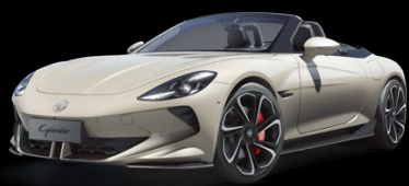
Běžová Ivory Metalický lak